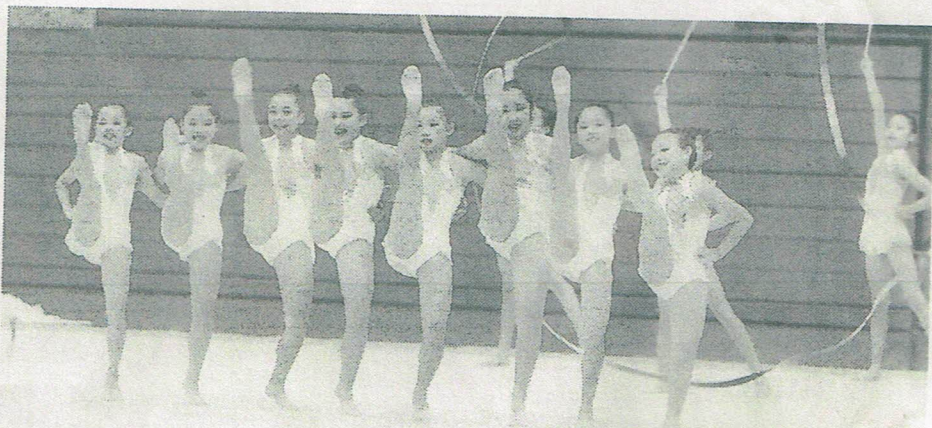
横一列に並んでラインダンスのような体操を披露する女の子たち

第14回くまもと体操フェスティバル(県体操協会主催)が12日、熊本市中央区出水の同市総合体育館で開かれました。