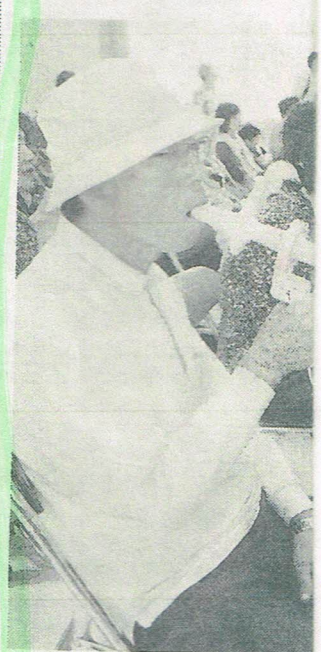
肺年齢を調べるた