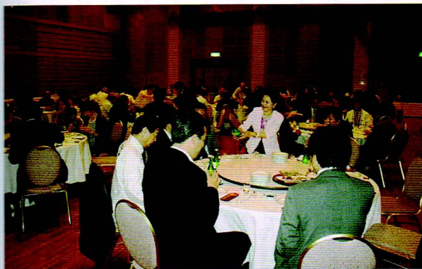
▲ホテル熊本テルサで開いた美少年火の国会の第14回交流会