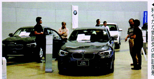
▲和やかな雰囲気の中、商談風景