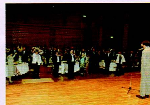
▲当日は火の国酒造の清酒で乾杯し開宴