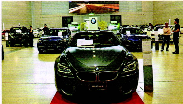
▲約500組が訪れたBMWフェア イン グランメッセ