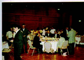
▲乾杯後は火の国酒造の清酒や焼酎を味わいながら交流した