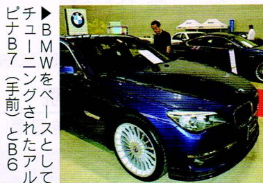
▶BMWをベースとしてチューニングされたアルピナB7(手前)とB6