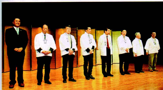
▲壇上で紹介した同会の幹事メンバー